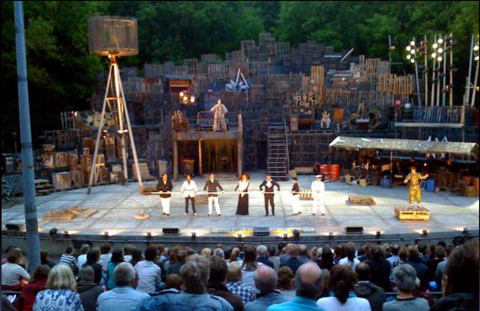
Theatergroep Het Amsterdamse Bos speelt de Storm van William Shakespeare (trekt ook veel bezoekers van buiten de stad)