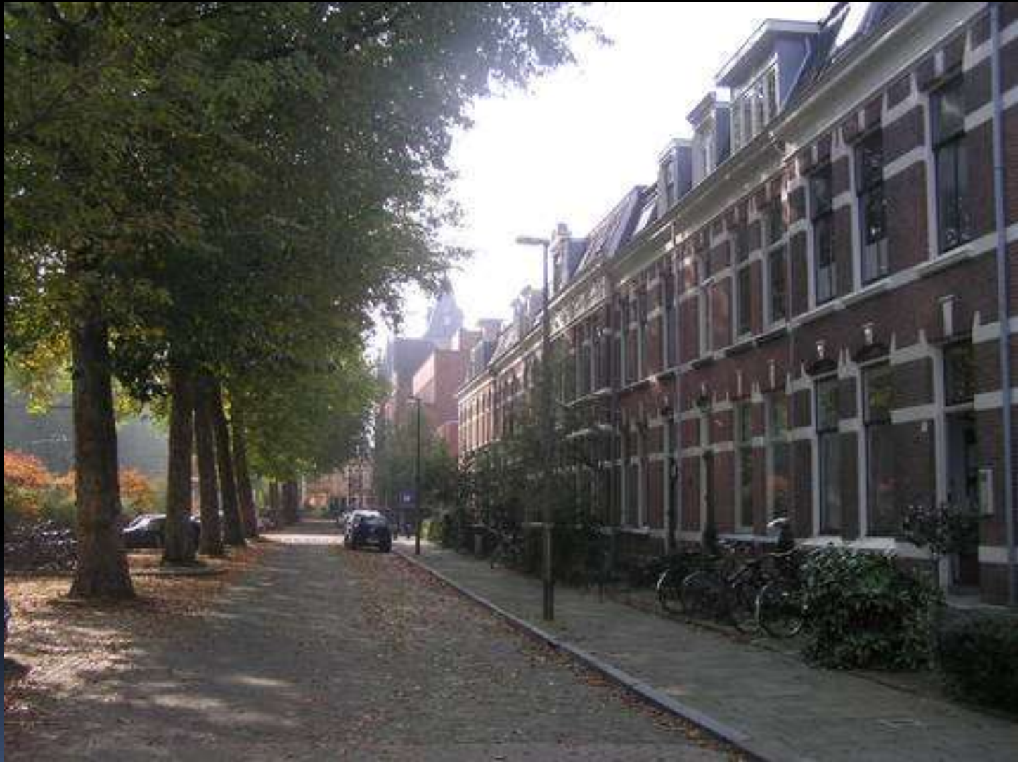
Wittevrouwen Utrecht: ooit arbeidersbuurt, nu onbetaalbaar voor arbeiders