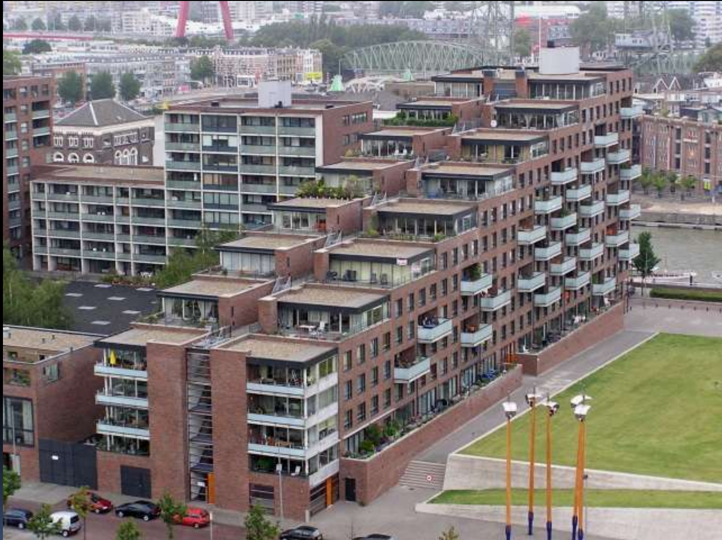
Kop van Zuid in Rotterdam, ooit vervallen woonbuurt en haventerrein