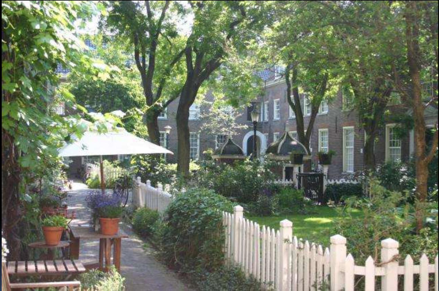
Hofje in de Jordaan, ooit oude volksbuurt nu hippe yuppenbuurt